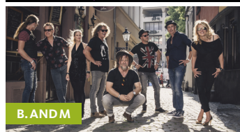
B. AND M