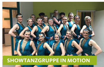
SHOWTANZGRUPPE IN MOTION