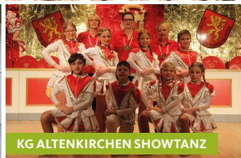
KG ALTENKIRCHEN SHOWTANZ